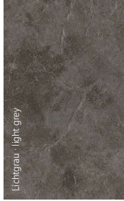
Lichtgrau · light grey