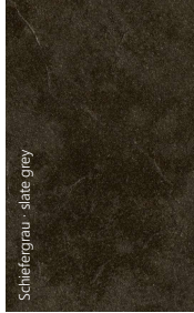
Schiefergrau · slate grey